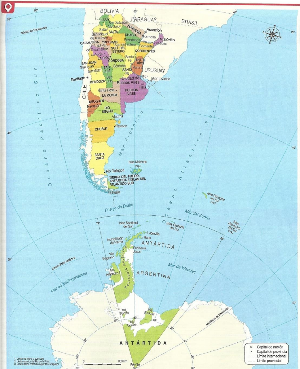
Mapa político de la República Argentina.